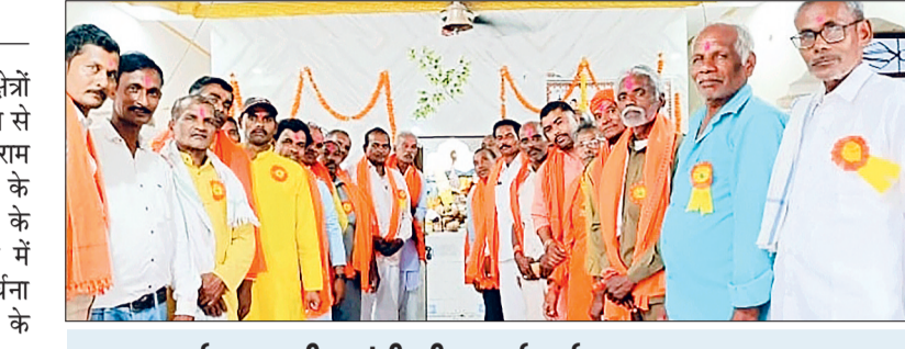
भक्त कर्मा माता की जयंती भी मनाई गई वहीं, ग्राम में भक्त कर्मा माता कर्मा जयंती शनिवार को धूमधाम एवं हर्षोल्लास के मनाया गया। जहां गांव की गलियों में कलश यात्रा में महिलाएं एवं युवतियां और छोटी-छोटी बहियों ने कलश यात्रा में शामिल होकर भव्य कलश यात्रा निकाली गई। बड़ी संख्या में लोग कलश यात्रा में शामिल हुए। मंदिर में मां कर्मा जयंती की कथा सुनाकर लोगों को प्रसाद वितरण किया गया।