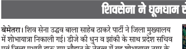
शिवसेना ने घूमघाम से निकाली शोभायात्रा